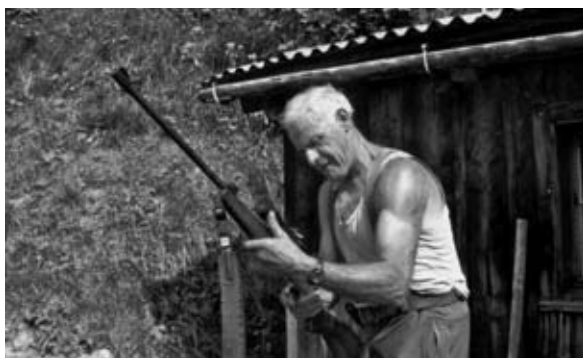
Prüfung des Jagdstutzers