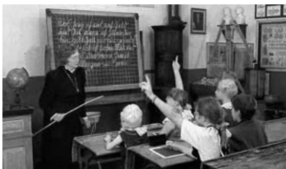
Schulunterricht früher: Frontalunterricht

Im Zuge der weiteren Abklärungen zu den bestehenden Schulanlagen musste leider festgestellt werden, dass im Archiv der Stadtverwal-