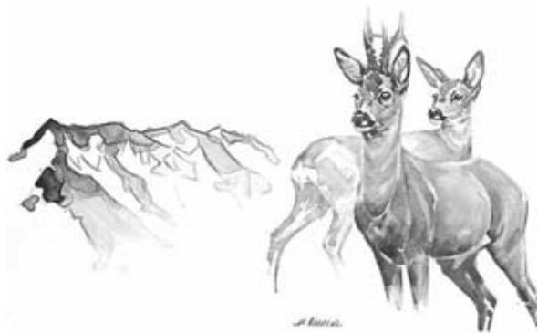
Jägersektion Falknis BKPV

stört und müssen gar flüchten, bedeutet dies, dass sie den ganzen Stoffwechsel und vor allem jenen in den Beinen wieder auf Hochbetriebstemperatur hochfahren müssen, wodurch sie vorzeitig enorm viel Energie verbrauchen. Diese wäre aber eigentlich für die strengen Wintermonate gedacht. Für sie bedeutet ein frühzeitiger Verbrauch der Energie den sicheren Tod. Daher setzt sich die Sektion nicht nur für die Ausscheidung solcher Wildruhezonen ein, sondern ruft die Bevölkerung auf, die Ruhezonen zu respektieren.