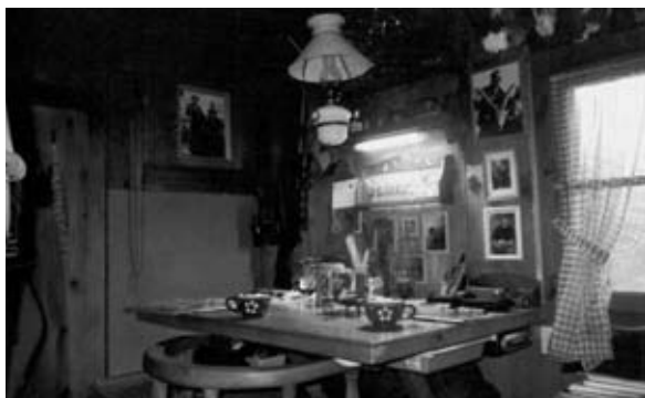
Blick in die Jagdstube