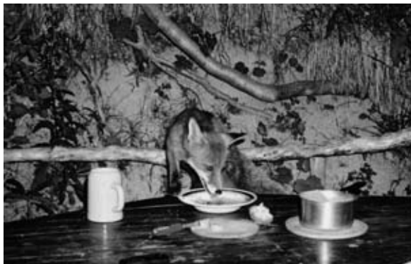
Der Fuchs zu Besuch

Das Wild wechselt je nach Temperatur zwischen Falknis und Guscha. Die Jäger wissen etwa, wie viele Tiere unterwegs sind. Zwischen Mai und Juni beginnt die Zeit, in der die jungen Kitz herumspringen, immer wieder wunderbare Erlebnisse. Als Jäger freuen wir uns, die Tiere zu beobachten, sie zu inspizieren und kennenzulernen aufgrund ihrer Merkmale, Farbe, Hornstellung, Körpergrösse und Verfärbungen im Gesicht. Daraus lässt sich auch das ungefähre Alter schliessen. Altersverfärbungen sind bei den weiblichen Tieren besser zu erkennen als beim Bock. Dieses Kennenlernen ist mindestens so spannend wie der eigentliche Abschuss.