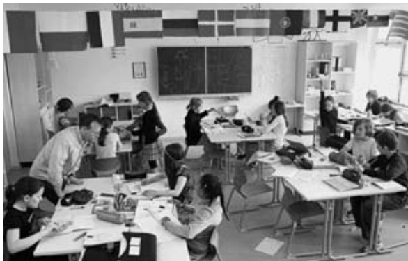
Schulunterricht heute: Gruppenarbeit binnendifferenziert