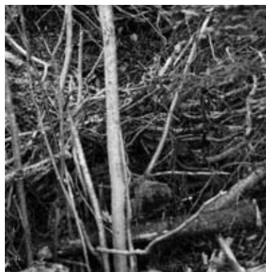
Die Bilder zeigen die Schanze in überwachsenem Zustand und die Zivilschutz-Männer beim Erstellen der Grabenmauern.