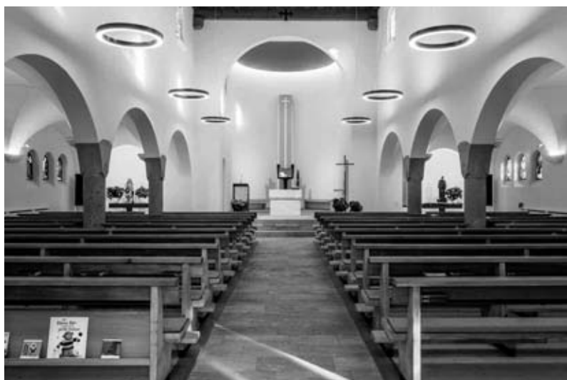
Renovierte Pfarrkirche St. Fidelis, Landquart